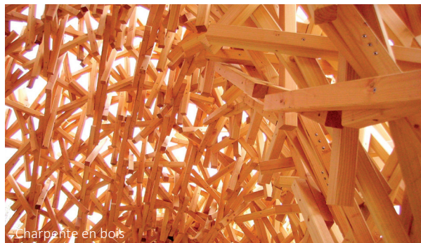
Charpente en bois

EmJi est une agence immobilière pour le moins atypique, qui propose à ses clients «un service à la carte». Aussi vaste sont les interprétations du terme, pourtant, ce type de service est bénéfique à chaque type de projets immobiliers. Les clients, peuvent, à leur guise, choisir un suivi complet ou partiel en ce qui concerne la gestion de leurs biens. EmJi immobilier simplifie la gestion locative des biens immobiliers pour les propriétaires qui souhaitent se libérer des contraintes inhérentes. En prenant intégralement en charge le processus de gestion, de la sécurité juridique, à l'encaissement des loyers, ou encore en assumant les réparations nécessaires avec l'aval des clients, EmJi endosse le rôle de «représentant du propriétaire» sur place, ou de «gestionnaire de propriétés».