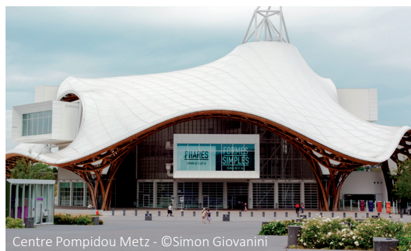
Centre Pompidou Metz - ©Simon Giovanini

Bien plus que dans l'immobilier traditionnel, EmJi s'inscrit dans une politique écologique et durable. Véritable passionné